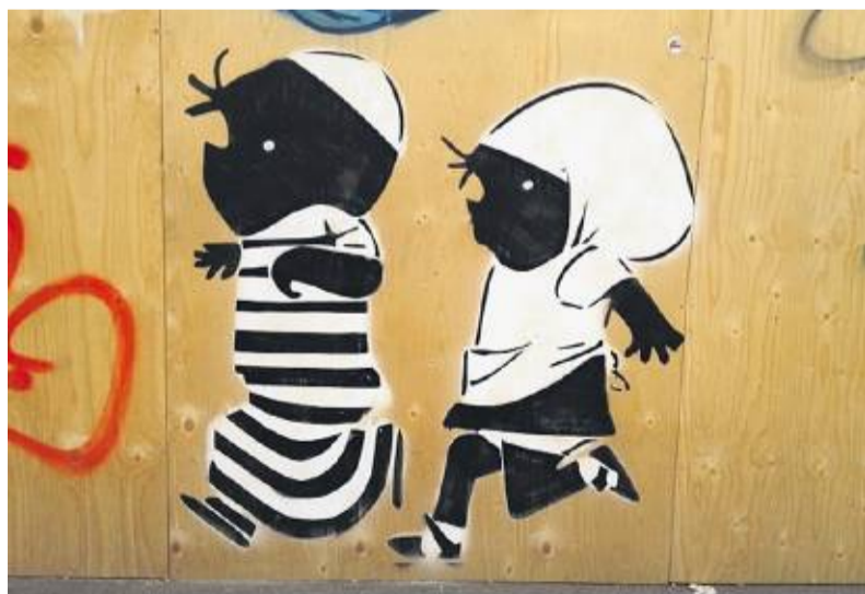
in zijn woonplaats Rotterdam.

In deze rubriek staan foto's waarop de sporen van de mens in de publieke ruimte op een originele manier zichtbaar zijn gemaakt: in afbeeldingen, teksten, verrassende uitingen van kunst. Stuur uw foto plus toelichting naar mensen@nrc.nl . Op nrc.nl/mensen lichten we toe welke beelden we zoeken.